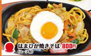
はまひが焼きそば 800円 (卵・漬物)