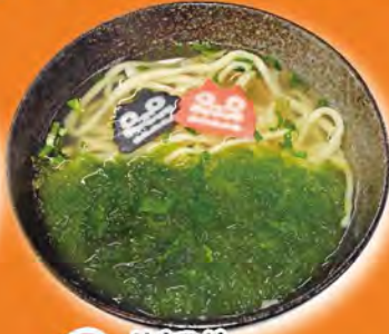
はまひがアーサそば 750円