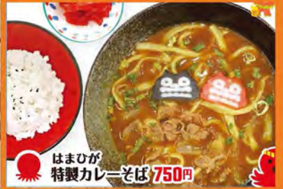
はまひが特製カレーそば 750円