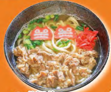
はまひが牛バラ肉そば 750円