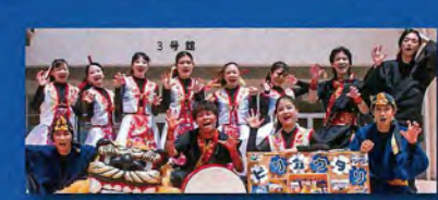
沖縄国際大学 芸能文化サークル ビリカウタリ