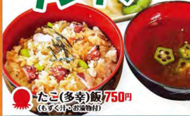
たこ(多幸)飯 750円 (もずく汁・お漬物付)