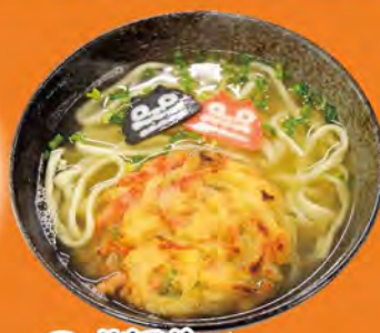
はまひがかき揚げそば 750円