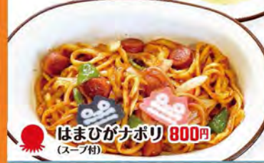
はまひがナポリ 800円 (スープ付)