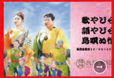
語やびら歌やびら島唄ぬ情 歌やびら 語やびら 島唄ぬ情 金曜日 20:00~