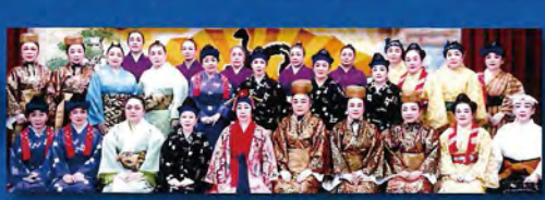
島袋岩子舞踊研究所・舞心の会