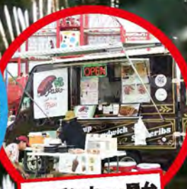
キッチンカー・屋台