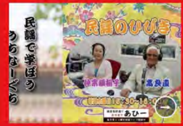
民謡のひびき 民謡のひびき 木曜日 15:00~