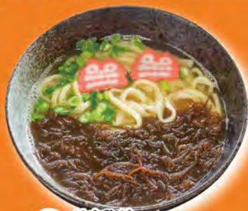
はまひがもずくそば 750円