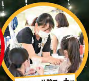
マルシェ・体験コーナー