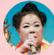
ワンダフルプー子