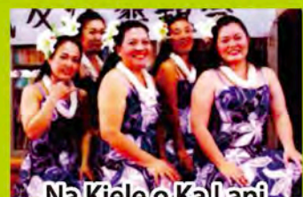
Na Kiele o Ka Lani